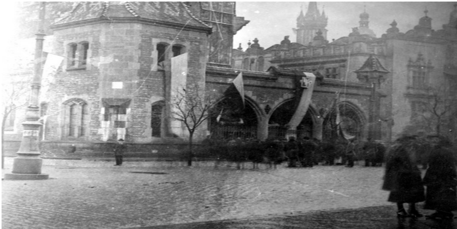
Pierwsza warta polska na odwachu krakowskim. Widoczne polskie flagi wiszące na budynku, 31 października 1918 r.

https://przystanekhistoria.pl/pa2/tematy/niepodleglosc/87425,Wyzwolenie-Krakowa-Galicji-i-Slaska-Cieszynskiego.html