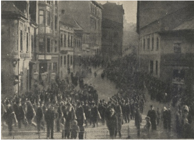
Pochód Milicji Polskiej Śląska Cieszyńskiego - Cieszyn 1918 r.