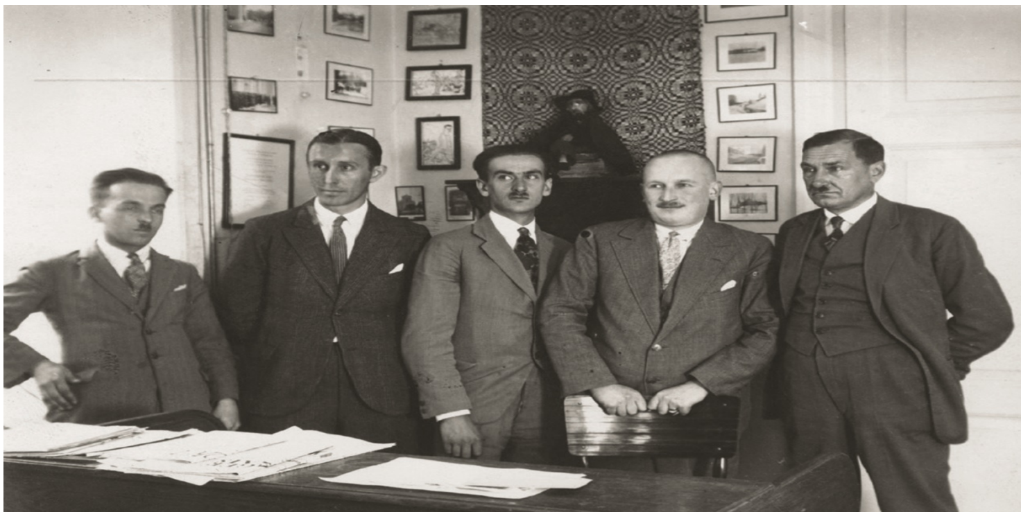
Redakcja wileńskiej gazety „Słowo”.

https://przystanekhistoria.pl/pa2/tematy/niepodleglosc/87128,Jozef-Mackiewicz-na-progu-niepodleglosci.html