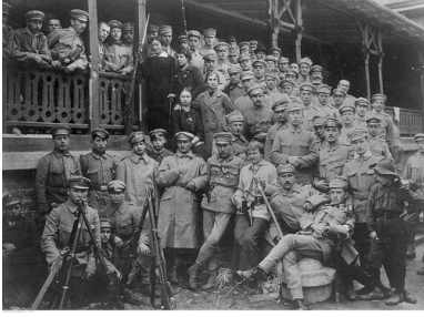
Strzelcy na krakowskich Oleandrach, sierpień 1914 r.