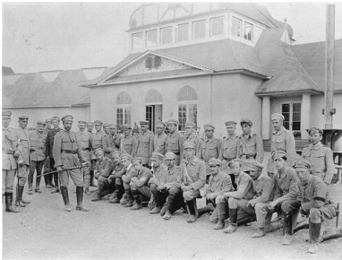
Strzelcy na krakowskich Oleandrach, sierpień 1914 r.