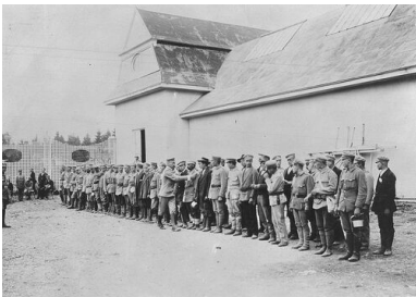
Strzelcy na krakowskich Oleandrach, sierpień 1914 r.

Piłsudski chciał pod osłoną państw centralnych wzniecić insurekcję antyrosyjską, Austriacy widzieli szansę na wywołanie na tyłach armii rosyjskiej dywersji umożliwiającej sprawne i szybkie zakończenie kampanii. Dalszych perspektyw nie było.