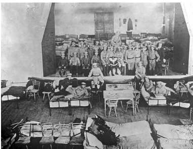
Strzelcy na krakowskich Oleandrach, sierpień 1914 r.