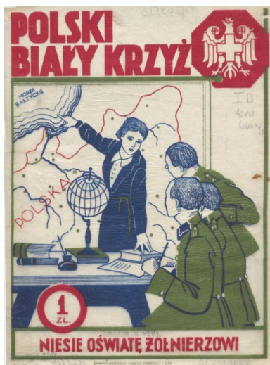
Cegiełka Polskiego Białego Krzyża z lat 30. XX w. ze zbiorów Biblioteki Narodowej

Promocja PBK przybierała różne formy. Od bardzo prostych – rozdawano ulotki, broszury, wieszano plakaty – do wymagających większej pracy, jak organizowanie uroczystych wieczorów poświęconych pamięci sławnych Polaków, zabaw tanecznych, bali, zbiórek ulicznych czy przedstawień. Urządzano też pokazowe mecze sportowe, konkursy hippiczne i turnieje brydżowe.