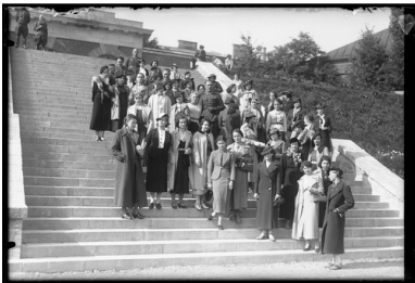
Kurs oświatowy Polskiego Białego Krzyża. Grupa uczestniczek kursu i oficerowie przed Bramą Straceń Cytadeli Warszawskiej, 1936 r.

Każdy żołnierz nieumiejący czytać miał obowiązek uczenia się w żołnierskich szkołach początkowych.