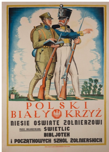
Plakat Edmunda Bartłomiejczyka promujący Polski Biały Krzyż.