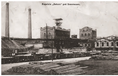
Kopalnia „Saturn” w Czeladzi, 1912 r.

Kolejne miesiące przyniosły unormowanie sytuacji, chociaż daleko było do jej zupełnego wyjaśnienia. W lipcu 1919 r. rozwiązano ostatecznie rady delegatów robotniczych. W sierpniu w Mysłowicach doszło do masakry górników przez oddział Grenzschutzu, co doprowadziło do wybuchu I Powstania Śląskiego. Powoli konflikt graniczny odsuwał się od Zagłębia na zachód.