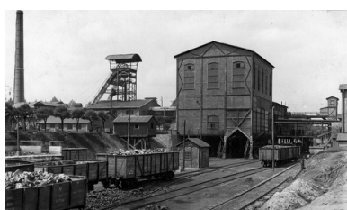
Kopalnia węgla Reden w Dąbrowie Górniczej.

Komuniści i socjaliści, którzy odebrali broń wycofującym się Austriakom i Niemcom, utworzyli własne oddziały militarne – odpowiednio Czerwoną Gwardię i Milicję Ludową. Jednocześnie powstawały jednostki organizowane przez byłych legionistów, podległe tworzącej się administracji państwowej. Na ich czele stanął przyszły premier Rzeczypospolitej – Felicjan Sławoj Składkowski 2 . Były one jednak zbyt słabe, aby przywrócić spokój na tym terenie, spokój ogromnie potrzebny, gdyż funkcjonowało tu wiele zakładów przemysłowych, przede wszystkim kopalnie węgla kamiennego, niezbędne dla gospodarki odradzającego się państwa. Normalna praca tych przedsiębiorstw była zagrożona przez rozwijające się ruchy rewolucyjne i niemieckie plany włączenia tego obszaru w swoje granice.