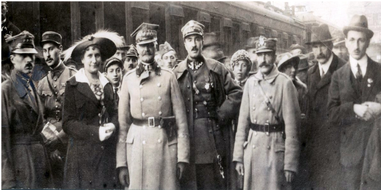
Delegacja polska na rokowania ryskie, w środku gen. Mieczysław Kuliński

https://przystanekhistoria.pl/pa2/tematy/niepodleglosc/76147,Traktat-ktory-nie-zadowalal-zadnej-ze-stron.htm