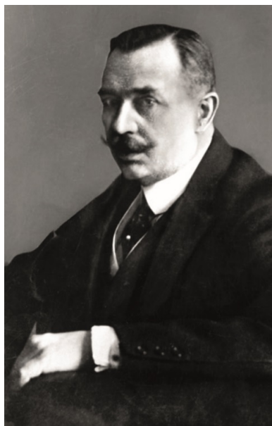
Maurycy Klemens Zamoyski. Fot.

Za pośrednictwem Towarzystwa Dobroczynności i Towarzystwa Opieki nad Chorymi (był wiceprezesem obydwu) pomagał chorym i cierpiącym. Pełnił też ważne funkcje w stowarzyszeniach zajmujących się różnymi dyscyplinami sportu. Zasiadał w niezliczonej ilości komitetów. Można powiedzieć, że brał udział w niemal każdej poważnej inwestycji w ówczesnej Warszawie. Szacuje się, że roczne wydatki Zamoyskiego na cele społeczne sięgały do 5 proc. dochodów ordynacji. O jego pozycji świadczyć może to, że proponowano mu wejście do Rady Regencyjnej Królestwa Polskiego.