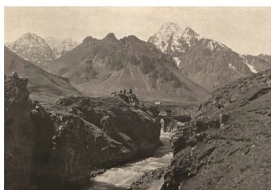
Góry Wielkiego Kaukazu. Fot.

Z tego powodu istotne znaczenie w planach Piłsudskiego odgrywały narody podbite przez Rosjan.