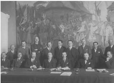
Obrady organizacji monarchistycznej - Warszawa, 19 grudnia 1926 r.