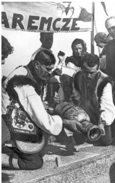
Delegacja Hucułów sypie przywiezioną ziemię.