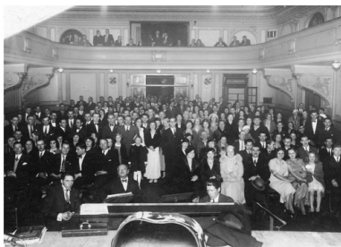
Koło teatralne "Wierni Hasłom Marszałka Józefa Piłsudskiego" w Buenos Aires. Widok na salę podczas spektaklu "Śmierć Okrzei", maj 1934 r.