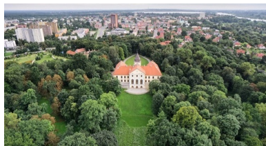
Pałac Tarnowskich w Dzikowie na tle Tarnobrzega.

krzyż zasługi złożony przeze mnie na wspomnianym wiecu, został oddany na Skarb Narodowy, na co otrzymałem pokwitowanie i co mnie bardzo cieszyło, że choć drobną cegiełką do tego Skarbu dołożyłem” 5 .