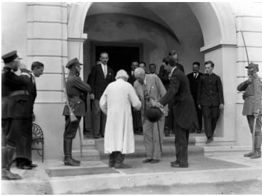
Prezydent RP Ignacy Mościcki wita się z Janem Słomką, 1929 r.

Do końca swoich dni był bystrym obserwatorem życia, które toczyło się wokół niego. Z dużą przenikliwością dostrzegał problemy wolnej już Polski.