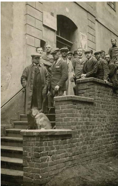
Wojciech Korfanty przed siedzibą dowództwa Grupy „Północ” wojsk powstańczych w Tworogu w