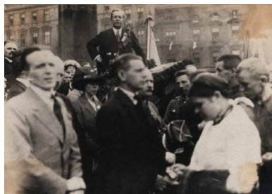
Wojciech Korfanty na trybunie podczas uroczystości przejęcia Górnego Śląska przez władze polskie, 20 czerwca 1922 r.

ogólnopolskiej scenie politycznej. Tylko jesienią 1923 r. został na krótko wicepremierem w rządzie Wincentego Witosa.