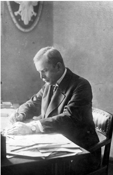
Wojciech Korfanty

Wrócił do polityki pod koniec I wojny światowej, gdy konflikt zaczął przybierać coraz gorszy obrót dla Niemiec. Korfanty wystartował w wyborach uzupełniających do Reichstagu z okręgu wyborczego Lubliniec-Gliwice-Toszek i 6 czerwca 1918 r. wygrał w pierwszej turze, zbierając 12 tys. głosów – znak, że jego antyniemiecka retoryka trafiła na dobry czas. 25 października 1918 r. wygłosił w Reichstagu swoje najgłośniejsze przemówienie parlamentarne. Otwarcie zażądał przyłączenia do Polski „polskich powiatów Górnego Śląska, Śląska Średniego, [...] Poznania, polskich Prus Zachodnich i polskich powiatów Prus Wschodnich”. Po czym wraz z pozostałymi polskimi posłami opuścił posiedzenie parlamentu niemieckiego, by już nigdy tu nie wrócić – swoją misję w Reichstagu uznał za skończoną, skoro odrodziła się Rzeczpospolita.