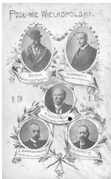
Grupa wielkopolskich posłów do parlamentu w Berlinie, 1918 r.

W 1904 r. wszedł także do pruskiego parlamentu krajowego. Startował z okręgu wyborczego Środa-Śrem-Września w Wielkopolsce, co było świadectwem zaufania, jakie pokładał w nim polski ruch polityczny zaboru pruskiego. Na forach obu parlamentów Korfanty z „talentem oratorskim” i „odwagą cywilną” (jak wspominał po latach Wojciech Trąmpczyński) atakował germanizacyjną politykę władz niemieckich w prowincjach wschodnich Rzeszy.