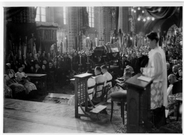
Nabożeństwo żałobne w kościele

Pogrzeb odbył się 20 sierpnia w Katowicach i zgromadził kilkadziesiąt tysięcy ludzi.