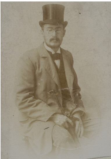
Eligiusz Niewiadomski. Fot.