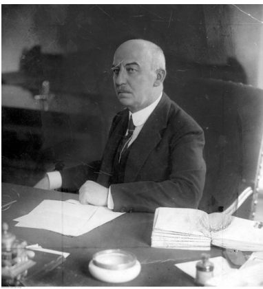
Gabriel Narutowicz.