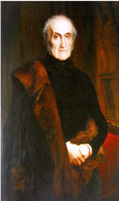
Książę Adam Jerzy Czartoryski

Emigranci – a byli wśród nich nie tylko wybitni politycy, wysokiej rangi wojskowi, wielcy poeci, ale i zawodowi oficerowie różnych rang, drobna szlachta, studenci czy żołnierze wywodzący się ze sfer rzemieślniczych i chłopskich – których liczba przekraczała nieco 10 tysięcy, nie rezygnowali z planów wywołania nowego ogólnonarodowego powstania skierowanego przeciwko zaborcom. Zamierzali też uzyskać dla swej walki poparcie zachodniej Europy. Poparcie co najmniej dyplomatyczne i materialne, a jeśli okazałoby się to możliwe, i militarne.