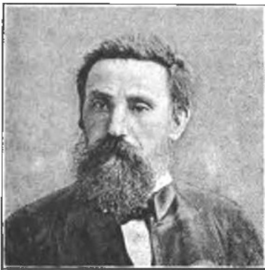
Portret Bolesława Limanowskiego z książki „Upominek. Książka zbiorowa na cześć Elizy Orzeszkowej (1866-1891)”

Oznaczało to wysunięcie na plan pierwszy postulatu walki o niepodległość.