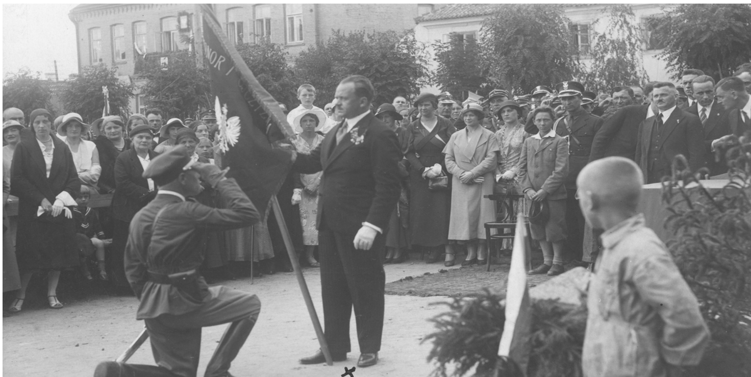
Wręczenie sztandaru oddziałowi powiatowemu Związku Rezerwistów RP w Sokółce, 1933 r.

https://przystanekhistoria.pl/pa2/tematy/niepodleglosc/100644,Niepodlegla-Sokolka-28-kwietnia-1919-r.html