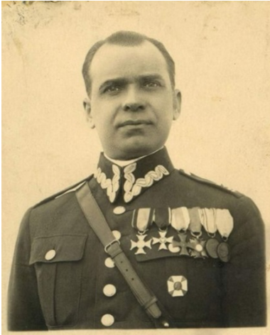
Gen. Nikodem Sulik.