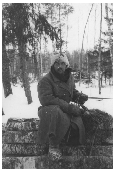
Mężczyzna na wozie z drzewem w lesie w okolicach Lipowej koło Sokółki (okres międzywojenny).

Wolność odzyskała więc właściwie bez walk. Ofiarę krwi za niepodległość Sokólszczyzny oddali jednak jej synowie kilka miesięcy wcześniej.