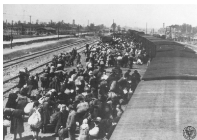
Selekcja transportu więźniów na rampie boczniczej kolejowej w obozie zagłady KL Auschwitz-Birkenau, 27 maja 1944 r.

„12 września 1944 organizacja ruchu oporu w obozie KL Auschwitz-Birkenau przekazała meldunek: »Jeszcze obecnie przychodzą transporty żydowskie ze wschodu«”.