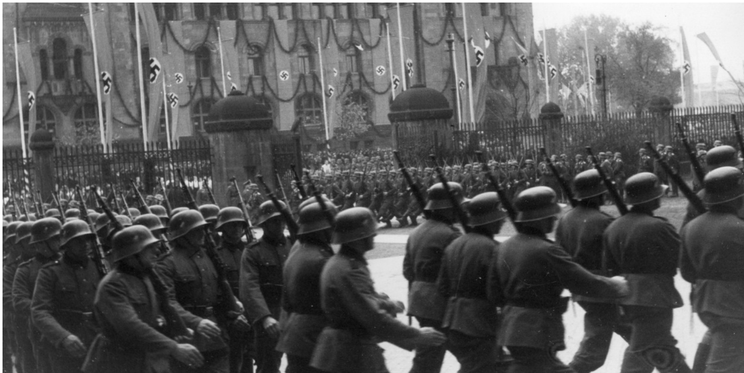
Objęcie przez Arthura Greiser`a urzędu namiestnika w Kraju Warty, 2 listopada 1939 r.

https://przystanekhistoria.pl/pa2/tematy/niemcy/94352,Winni-nieosadzeni-rozwazania-o-niemieckich-sprawcach-h-w-rocznice-procesow-Greiser.html