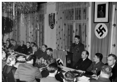
Spotkanie świąteczne NSDAP.

Schlesien (prowincja Śląsk; od 1941 Provinz Oberschlesien , tj. prowincja Górny Śląsk); 1939 - 1940.