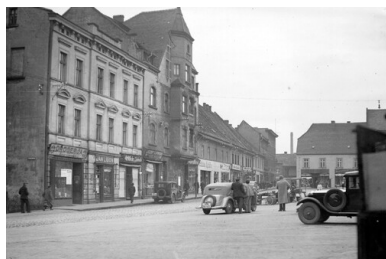
Rynek w polskim Mikołowie, II Rzeczpospolita, przełom lat 20. i 30. XX w.