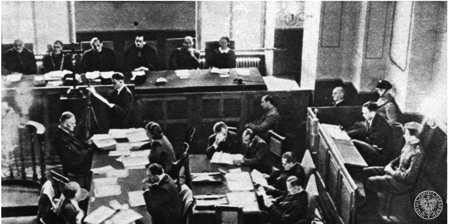
Sala rozpraw w gmachu Sądu Okręgowego w Krakowie w czasie procesu Amona Götha przed Najwyższym Trybunałem Narodowym, 1946 r.

https://przystanekhistoria.pl/pa2/tematy/niemcy/85945,Morderca-z-Plaszowa.html