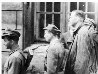
Amon Göth prowadzony pod eskortą w trakcie swojego procesu przed Najwyższym Trybunałem Narodowym w Krakowie, 1946 r.

„za najwłaściwszą uważał karę śmierci przez zastrzelenie więźnia na miejscu [...] Strzelał on przy każdej sposobności. [...] Przy budowie drogi zastrzelił kobietę, która jego zdaniem nie naładowała dość dużo kamieni na taczki. Wypadków takich zna każdy więzień płaszowski dziesiątki, jeśli nie setki”.