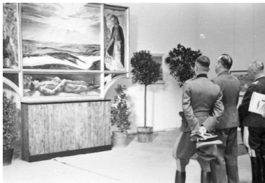
Hans Frank (w środku) w towarzystwie nierozpoznanych osób podczas zwiedzania galerii w Krakowie.

Trudno ustalić precyzyjną liczbę dóbr kultury zagrabionych przez administrację Generalnego Gubernatora. W przemówieniu wygłoszonym z okazji trzylecia GG 26 października 1942 r. Frank oświadczył, że na jego terytorium „zabezpieczono” około 90 proc. dzieł sztuki, oraz stwierdził, że są one własnością Generalnego Gubernatorstwa. Przez cały okres okupacji dobra kultury służyły jako wyposażenie wewnątrz urzędowych lub prywatnych siedzib dygnitarzy nazistowskich.