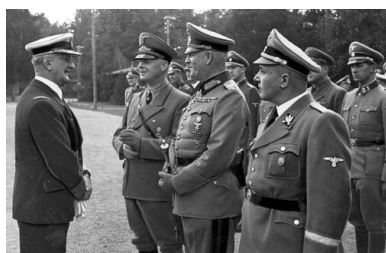
Od lewej: admirała Miklos Horthy, minister spraw zagranicznych Rzeszy Joachim von Ribbentrop, marszałek Wilhelm Keitel, Reichsleiter Martin Bormann.

Wartym odnotowania jest, że pozostali uwięzieni naziści wyrazili ulgę z powodu śmierci byłego współpracownika. Twierdzili bowiem, że Ley mógłby w trakcie procesu skompromitować nie tylko siebie, ale i całą strukturę niemieckiego reżimu.