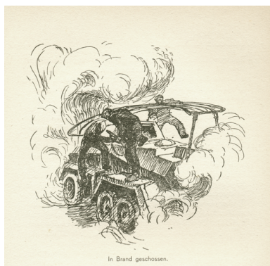
Szkic przedstawiający zniszczony