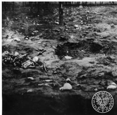
Ekshumacje na terenie obozu zagłady w Treblince. Widoczne porozrzucane kości, 7 listopada 1945 r.

Początkowo ciała zamordowanych grzebano w ziemi, kładąc je warstwami i przesypując wapnem chlorowanym. Po wizycie Heinricha Himmlera w Treblince, od około lutego 1943 r. zwłoki odkopywano i palono. Do wydobywania ciał używano mechanicznych koparek (Bagry), a ich dźwięk stał się charakterystycznym wyróżnikiem obozu.