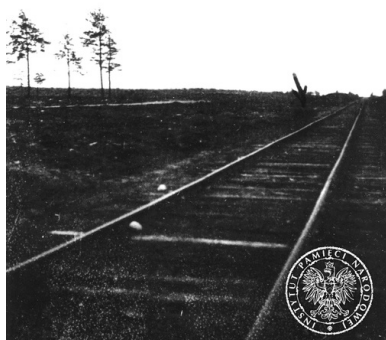
Widok na bocznice kolejowa obozu zagłady w Treblince, 7 listopada 1945 r.