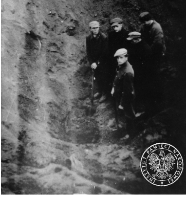
Członkowie komisji ekshumacyjnej w północno- wschodniej części obozu, 7 listopada 1945 r.