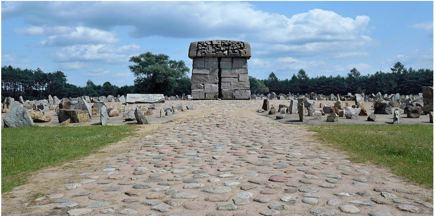
Pomnik na terenie obozu zagłady Treblinka II.

https://przystanekhistoria.pl/pa2/tematy/niemcy/61707,Oboz-zaglady-w-Treblince.html