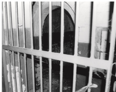
Cela w Forcie VII, w której 6 stycznia 1940 r. strażnicy dokonali masakry przedstawicieli elity wielkopolskiej - widok obecny.

Następnie odbywał się apel. Wachman wchodził do celi, wszyscy stawali na baczność, starsza celi składała raport o stanie obecnych. Następnie kończyło się porządkowanie celi, jak np. mycie podłogi. Była ona z cegieł. O godz. 12 był obiad, o 18 kolacja.