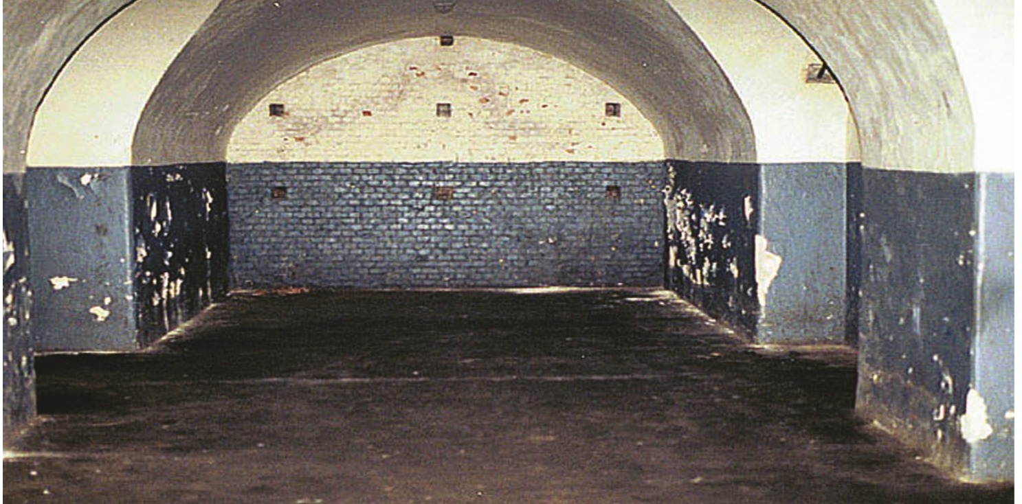
Cela w Fortcie VII, widok obecny.

https://przystanekhistoria.pl/pa2/tematy/niemcy/61362,Wieziennio-obozowe-wspomnienia-Wandy-Serwanskiej.html