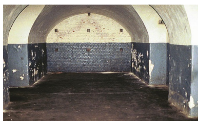
Cela w Forcie VII, widok obecny.

Wiem również z opowiadań, że na Forcie były egzekucje i to pod ścianą, o której co dopiero wspomniałam. Na ścianie tej widziałam ślady krwi.