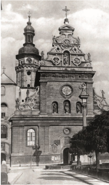
Kościół bernardyński. Zdjęcie niemieckie z lat czterdziestych.