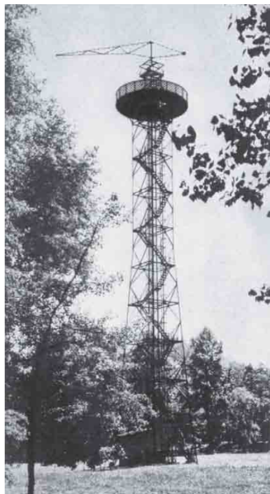
Wieża spadochronowa w Katowicach (AIPN)

pewna starsza pani, by opowiedzieć historię swej siostry, przedwojennej harcerki. Miała ona znajdować się na platformie wieży pośród grupy obrońców. Dopóki używano wyłącznie broni ręcznej, dopóty wymiana strzałów uchodzić mogła za równorzędną. Lecz po pierwszym wystrzale z niemieckiego działka przeciwpancernego załoga wieży postanowiła uciec; ponieważ winda była już unieruchomiona, schodzono, chwytając się bocznych fragmentów konstrukcyjnych. Schody znajdowały się wówczas pod silnym ostrzałem.