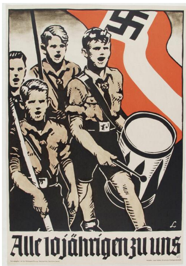
Nazistowski plakat propagandowy wzywający dzieci do członkostwa w Hitler-Jugend