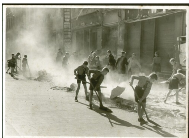
Członkowie Hitler-Jugend porządkujący ulice po alianckim nalocie na Gliwice, 1943 r.

Umundurowane formacje HJ często wykorzystywano do okraszania partyjnych wieców i innych tego typu wydarzeń. Członkowie tej organizacji byli też zobowiązani do udziału w licznych zbiórkach pieniędzy, materiałów wtórnych, prezentów dla żołnierzy itd. Wydarzeniom tym nadawano duży rozgłos propagandowy. Podobnie było z organizowanymi przez HJ zawodami sportowymi. W okresie Bożego Narodzenia członkowie HJ wykonywali zabawki, które następnie sprzedawane były na jarmarkach bożonarodzeniowych organizowanych we wszystkich większych miejscowościach. Zgromadzone środki przekazywano na cele opieki społecznej.