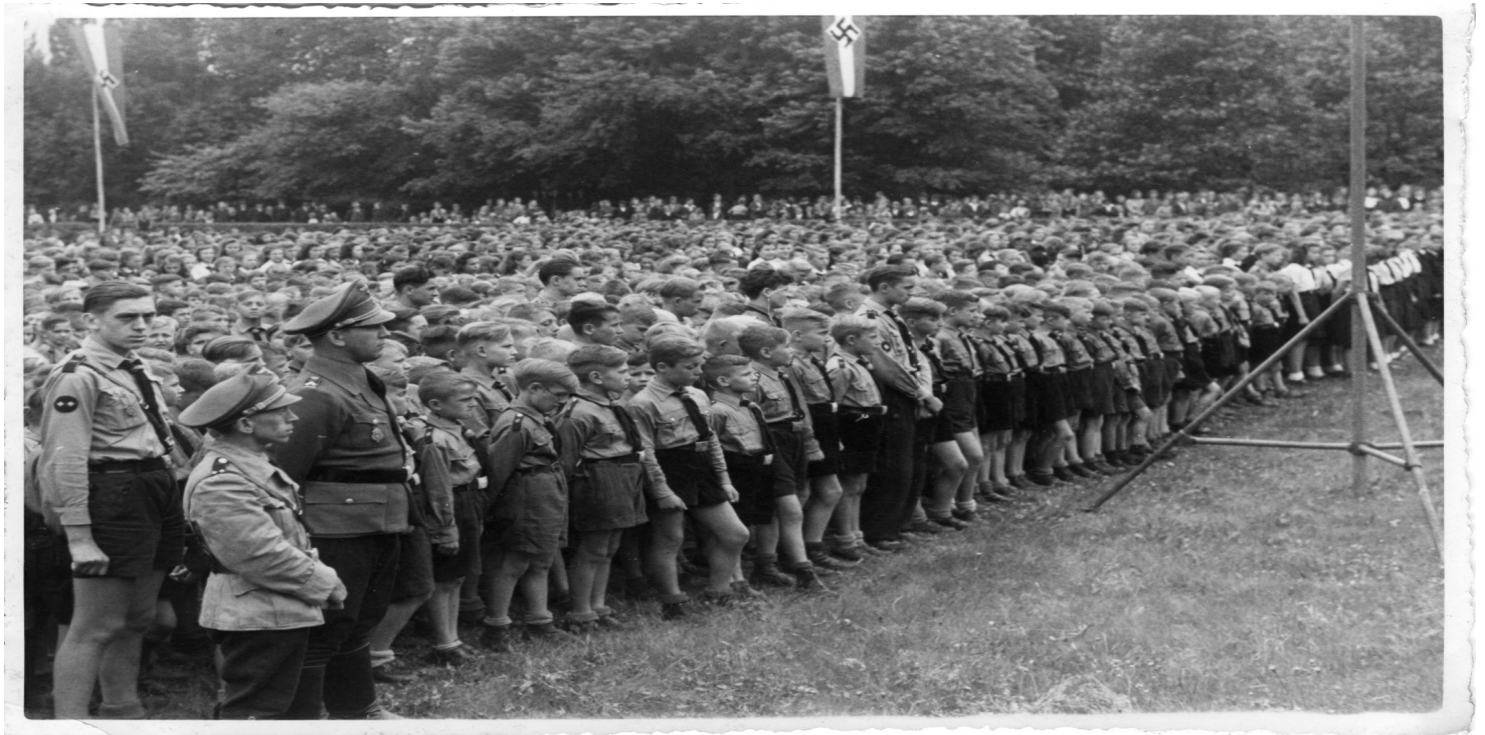
Uroczystość z udziałem Hitler-Jugend w Gliwicach (AIPN)

https://przystanekhistoria.pl/pa2/tematy/niemcy/29353,Hitler-Jugend-na-Gornym-Slasku.html