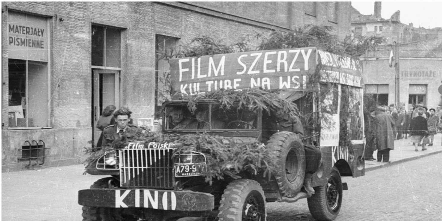
Akcja nagłaśniająca przyjazd kina objazdowego

https://przystanekhistoria.pl/pa2/tematy/nauka-i-technika/93407,Kultura-i-nauka-w-sluzbie-ideologii.html