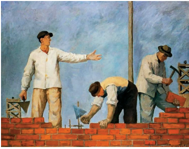
Socrealistyczny obraz Aleksandra

Nauka, kultura, sztuka, normy zachowań społecznych – ludzki dorobek intelektualny, zwyczaje, sposób oglądu rzeczywistości, słowem wszystko – miało zostać podporządkowane komunistycznej ideologii. Miała ona być spoiwem umożliwiającym kierowanie przez partyjny establishment bezwolną i niezdolną do samodzielnego myślenia oraz działania ludzką masą.