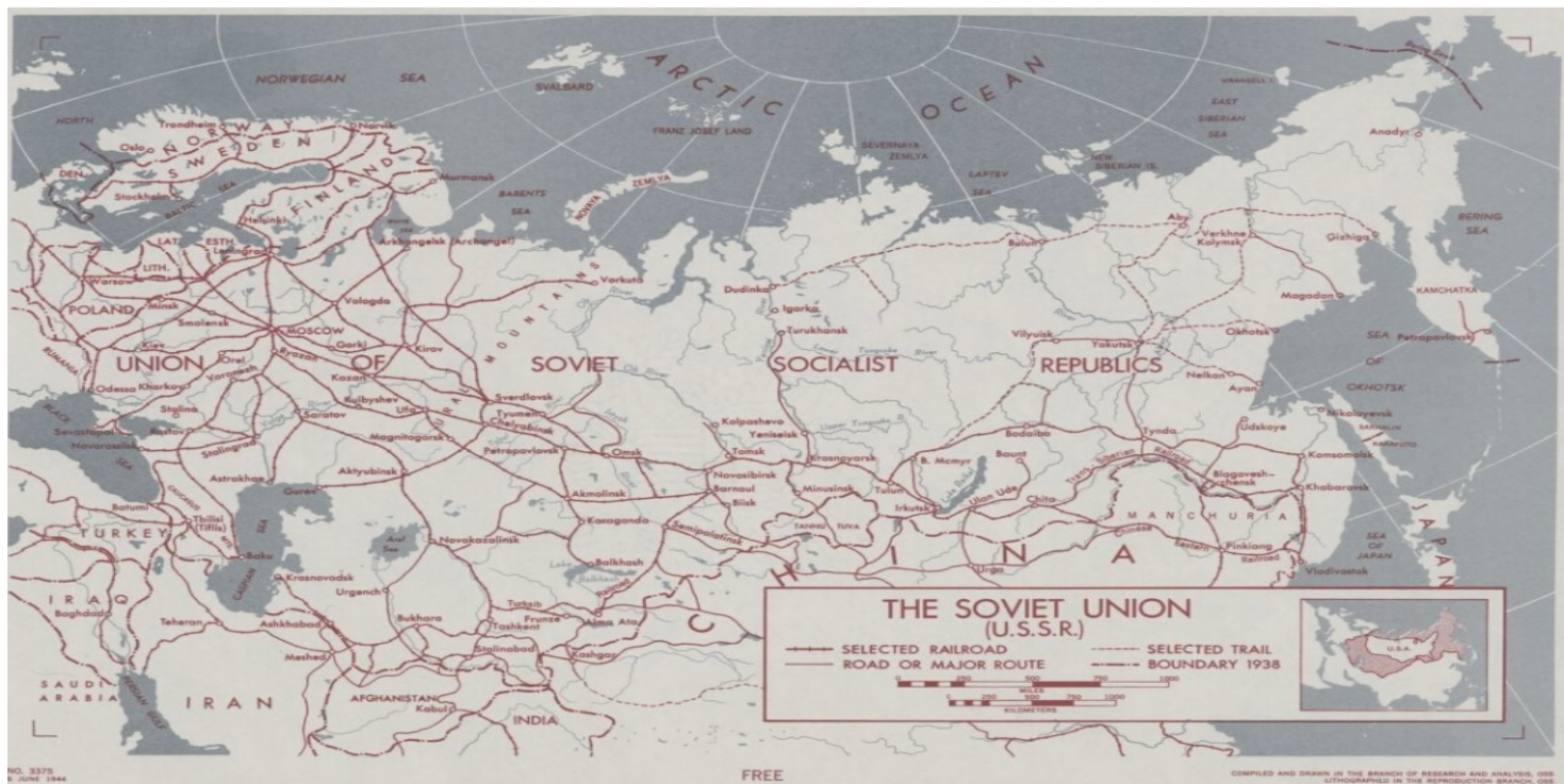
The Soviet Union (U.S.S.R.), Waszyngton 1944

https://przystanekhistoria.pl/pa2/tematy/nauka-i-technika/106389,Polscy-biolodzy-w-czasach-lysenkizmu.html