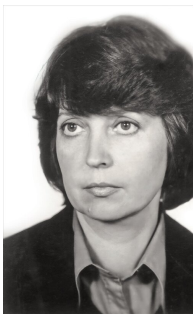
Alicja Grześkowiak