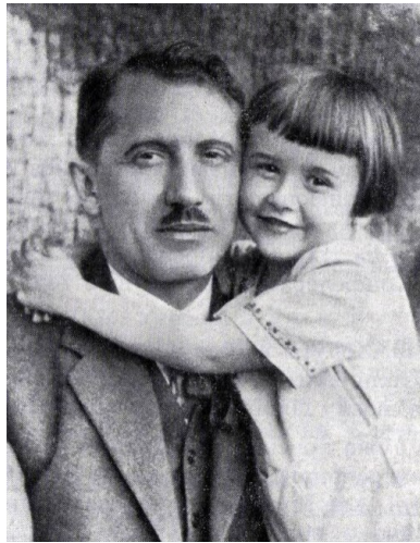
Jewhen Konowalec z synem w Berlinie.

Kierowana przez Konowalca OUN, w opinii niektórych politycznych działaczy ukraińskich, jak np. Kost`a