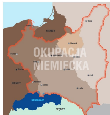
Granice Polski z 1 września 1939 r. Okupacja niemiecka: Obszar włączony bezpośrednio do Rzeszy Generalne Gubernatorstwo Okręg Białostok Obszary włączone do Komisariatu Rzeszy Ukraina i Komisariatu Rzeszy Ostland Niemcy przed 1 września 1939 r. Okupacja słowacka