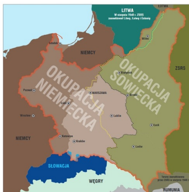
Granice Polski z 1 września 1939 r. Okupacja niemiecka: Obszar włączony bezpośrednio do Rzeszy Generalne Gubernatorstwo Okupacja sowiecka Okręg Wileński przekazany przez ZSRS Litwie i wraz z nią wcielony do ZSRS w 1940 r. Okupacja słowacka Linia podziału Polski pomiędzy ZSRS i Niemcy: linia ustalona w pakcie Ribbentrop-Mołotow 23 sierpnia 1939 r. linia demarkacyjna ustalona 26 września 1939 r.

Zapewne celowym i wygodnym mechanizmem ze strony Sowietów w walce z polskimi elitami było również czasowe pozostawianie zajętych obszarów bez wyraźnej kontroli Armii Czerwonej lub oddawanie ich w ręce powstających samorzutnie formacji paramilitarnych. Z jednej strony zdejmowało to oficjalnie odpowiedzialność z Sowietów za dokonywane zbrodnie i akty bezprawia, a z drugiej pozwalało – za sprawą propagandy, bardzo często topornej – rozwiązać rękami Ukraińców, Białorusinów i Żydów kwestię polskiego oporu. Oczywiście nie można przyjąć tłumaczenia, że ta część społeczeństwa białoruskiego i ukraińskiego, ale i żydowskiego, która brała udział w walce ze społeczeństwem i państwem polskim, stała się przypadkowym narzędziem w sowieckiej machinie zbrodni. Inicjatywa oraz brutalność mniejszości ukraińskiej w jej zbrodniczej działalności wobec Polaków daleko przekraczała pułap, który możemy uznać za realizację nakreślonych zadań dywersyjnych. Wydaje się, że skuteczność sowieckich działań, widoczna w skali i masowości terroru, w pewien sposób zaskakiwała samych autorów kampanii propagandowej, którzy w swych raportach pisali o skali przemocy i jej skutkach w postaci masowo odnajdywanych ciał pomordowanych Polaków.