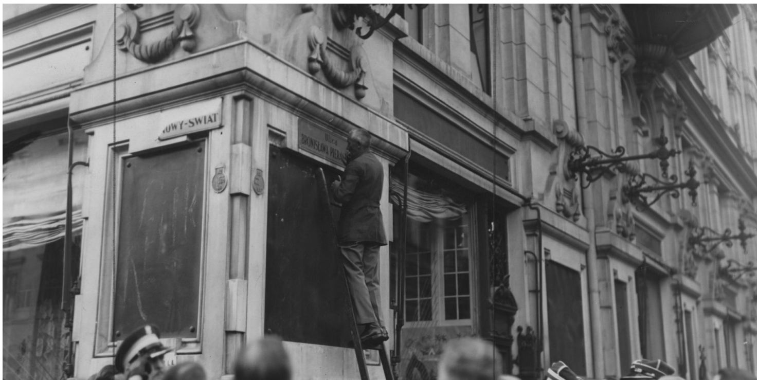
Uroczystość przemianowania ulicy Foksał na ulicę Bronisława Pierackiego - czerwiec 1924 r. (NAC)

https://przystanekhistoria.pl/pa2/tematy/mniejszosci-narodowe/68808,Smierc-ministra.html