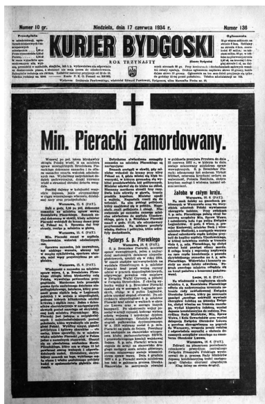
Pierwsza strona Kuriera Bydgoskiego z 17 czerwca 1934 r.