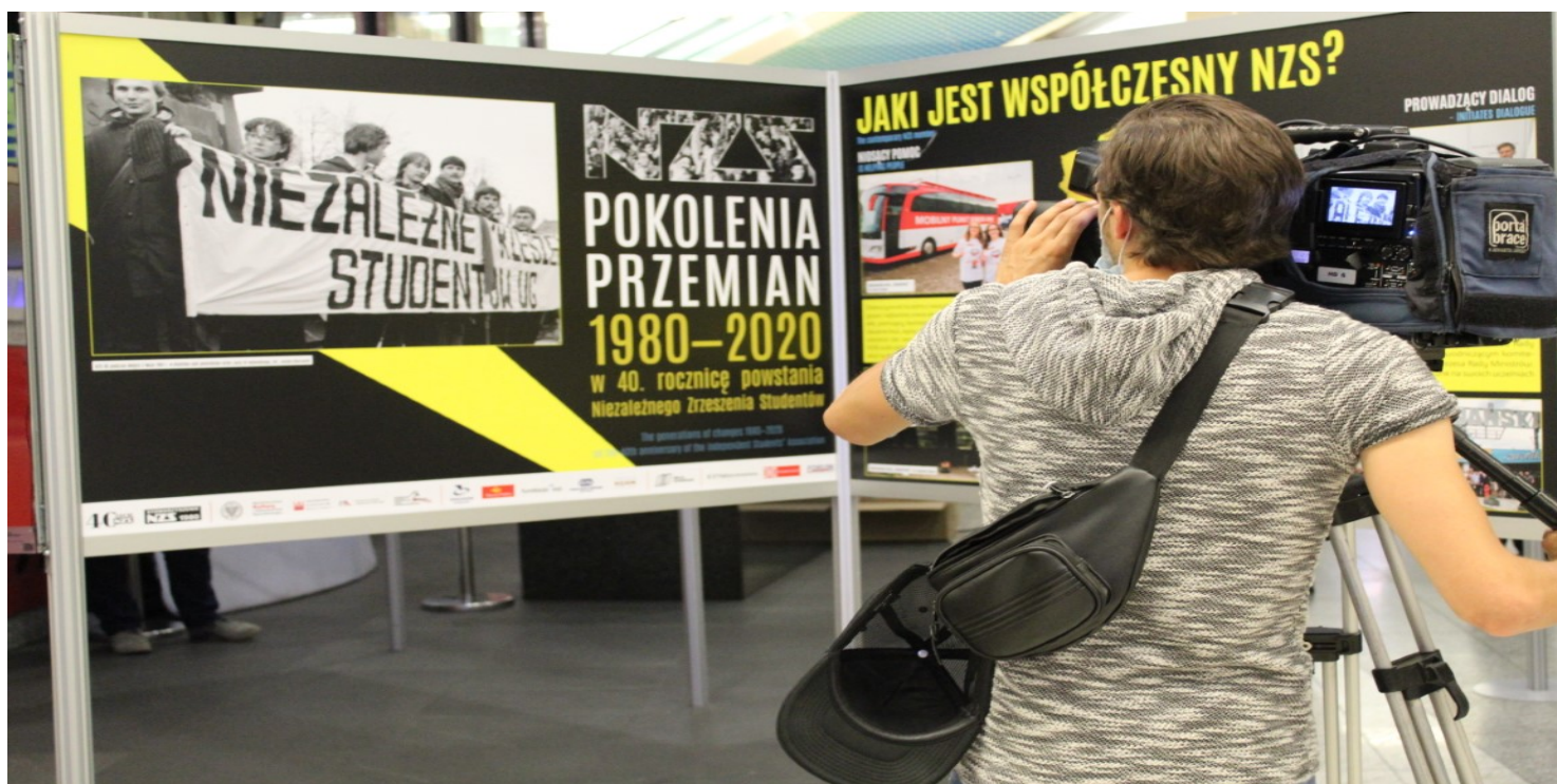
Odślonięcie wystawy „NZS – pokolenia przemian 1980-2020” na Dworcu Głównym w Krakowie.

https://przystanekhistoria.pl/pa2/tematy/mlodziez/87967,Bialostockie-Niezalezne-Zrzeszenie-Studentow-w-latach-1982-1983.html