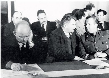
Posiedzenie Tymczasowego Rządu Jedności Narodowej; na pierwszym planie od lewej: Stanisław Mikołajczyk, Edward Osóbka-Morawski oraz marsz. Michał Rola-Żymierski, 1946 r.

Rozpoczynała się kluczowa rozgrywka o losy Polski, a centralnym jej punktem miały być zapowiedziane w postanowieniach konferencji jałtańskiej wybory. Polska Partia Robotnicza, nieposiadająca szerokiego poparcia społecznego, którym cieszył się Mikołajczyk i PSL, grała na czas.