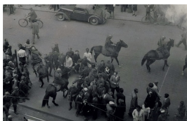
Solidarnościowa demonstracja po wydarzeniach w Krakowie - milicja ilicja na koniach rozpędza studentów na Świętym Marcinie w Poznaniu, 13 maja 1946 r.

Władze wykorzystały wydarzenia w Krakowie do zamachu na niezależność uczelni wyższych. 17 maja 1946 r. wydano dekret powołujący Radę Szkół Wyższych, która miała być organem podległym rządowi i nadzorować uczelnie.