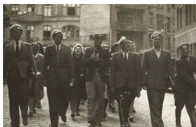
Solidarnościowa demonstracja poznańskich studentów po wydarzeniach w Krakowie, 13 maja 1946 r.