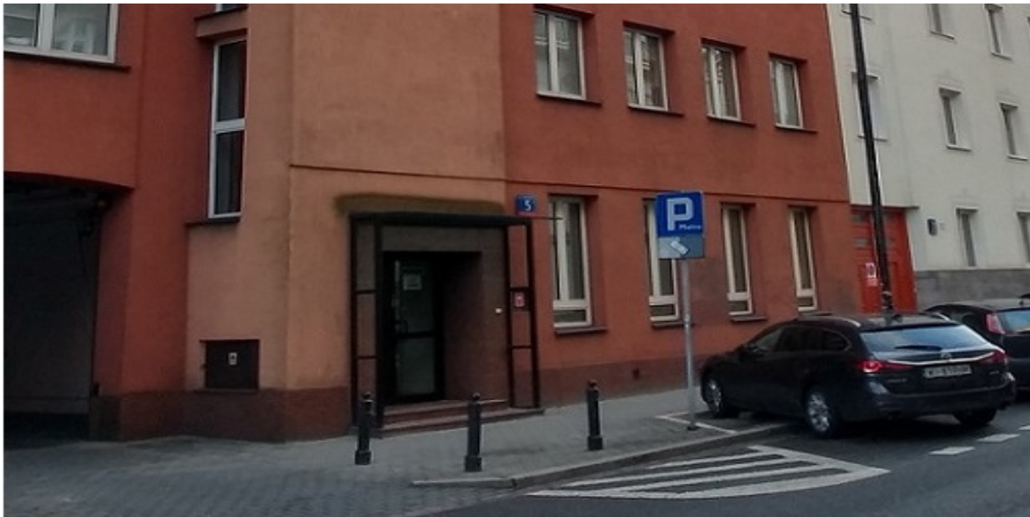
Budynek przy ulicy Nowogrodzkiej 5 w Warszawie, w którym (na I piętrze) mieścił się klub studencki „Babel” – widok współczesny

https://przystanekhistoria.pl/pa2/tematy/mlodziez/106572,Babel-Klub-studencki-zagraza-bezpieczenstwu-i-porzadkowi-publicznemu.html