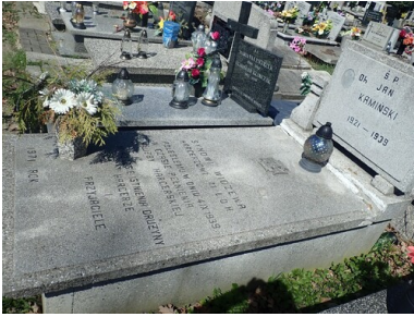
Grób Janka Kamińskiego.

- pisał w powojennych wspomnieniach druh Hieronim Michalski.