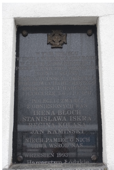
Tablica upamiętniająca poległych harcerzy i harcerki na dworcu Łódź-Widzew.