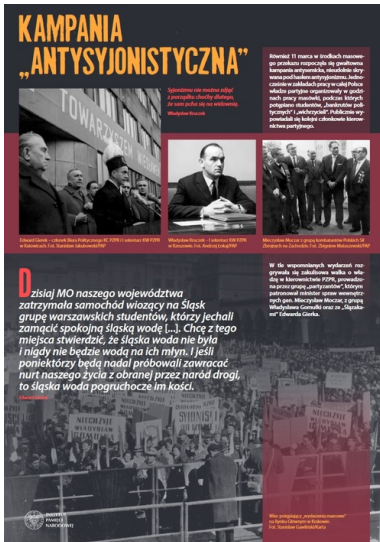
Plansza wystawy IPN Marzec'68