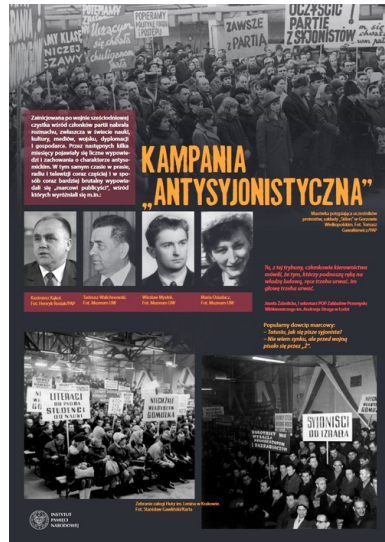
Plansza wystawy IPN Marzec'68