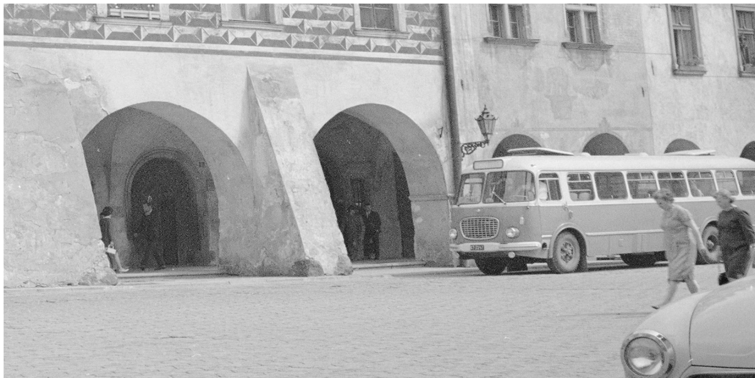
Rynek w Tarnowie, 1969 r.

https://przystanekhistoria.pl/pa2/tematy/marzec-1968/79490,Tarnowski-Marzec03968.html