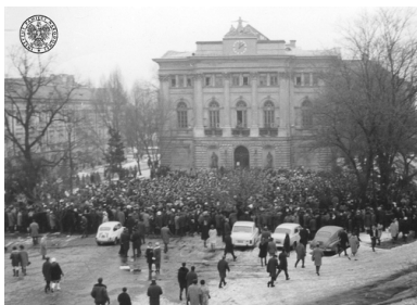
Wiec przed gmachem Biblioteki Uniwersytetu Warszawskiego w dniu 8 III 1968 r. Zegar na budynku wskazuje godzinę 12:10