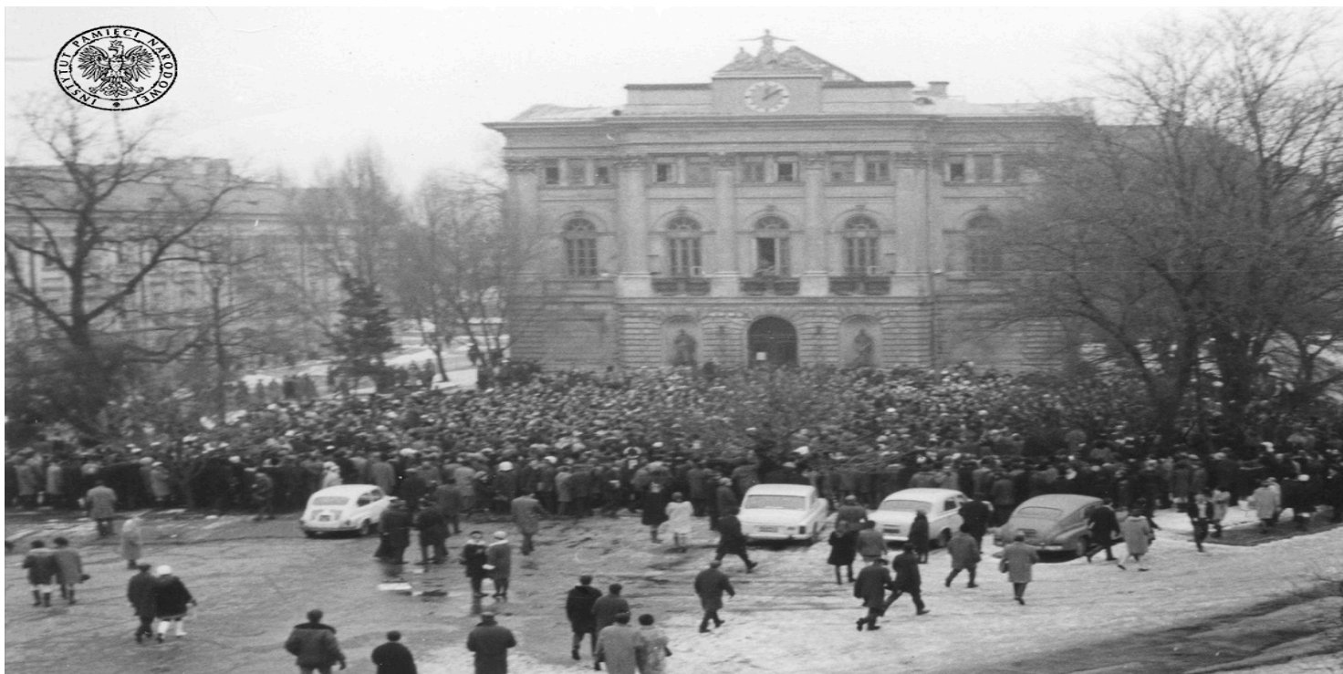
Wiec przed gmachem Biblioteki Uniwersytetu Warszawskiego w dniu 8 III 1968 r. Zegar na budynku wskazuje godzinę 12:10 (fot. z zasobu IPN)

https://przystanekhistoria.pl/pa2/tematy/marzec-1968/105981,Pierwszy-wiec-Marca-68.html