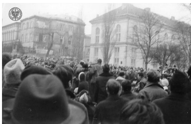
Tłum zebrany przed gmachem BUW w dniu 8 III 1968 r.