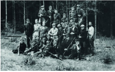
Oddział samoobrony na Wołyniu.

dochodziło do zabójstw pojedynczych osób, a czasem całych rodzin, głównie postaci wyróżniających się w swoim środowisku pozycją społeczną, pełnioną funkcją, autorytetem i potencjalnymi możliwościami organizowania polskiej konspiracji i obrony.