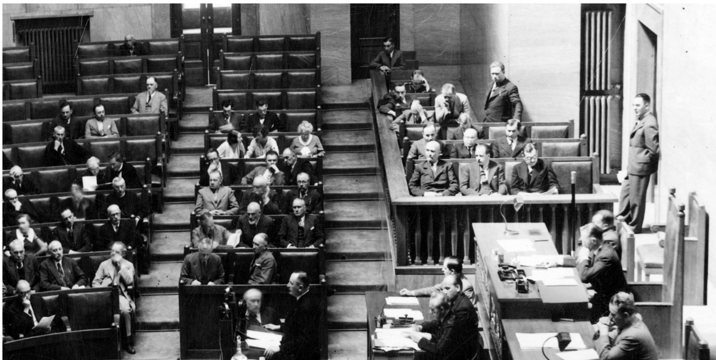
Plenarne posiedzenie Sejmu w 1935 roku w sprawie nowej ordynacji wyborczej

https://przystanekhistoria.pl/pa2/tematy/maj-1926/125059,Pelzajacy-autorytaryzm-w-II-RP.html