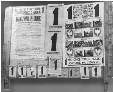
Materiały wyborcze BBWR-u z kampanii do Sejmu 1930 roku

W czasie wyborów parlamentarnych w 1928 r. Bezpartyjny Blok Współpracy z Rządem starał się uzyskać większość parlamentarną względnie łagodnymi środkami oddziaływania na proces wyborczy (wykorzystywano aparat państwowy do agitacji wyborczej, stosowano nielegalne subwencje na kampanie wyborczą). Bezpartyjny Blok wygrał, jednak nie osiągnął większości. O ile centrolewica, szczególnie w obliczu wyborczej klęski endecji, była gotowa do pewnych form współpracy, o tyle celem sanacji było dążenie do rządów samodzielnych. Szczególnej wymowy nabrała tzw. sprawa Czechowicza, czyli wydania osiągniętej nadwyżki budżetowej na kampanię wyborczą BBWR w 1928 r. Odbyło się to na osobiste polecenie Józefa Piłsudskiego. Mimo rozprawy przed Trybunałem Stanu (26-29 czerwiec 1929 r.) sprawy nie udało ostatecznie osądzić i powróciła do sejmu, gdzie była skutecznie odwlekana. Wydatki zostały „zalegalizowane” przez nowy