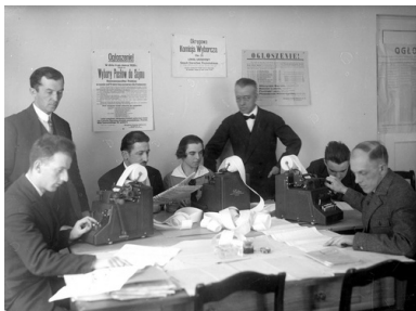
Liczenie głosów podczas wyborów do Senatu w 1928 roku w Warszawie