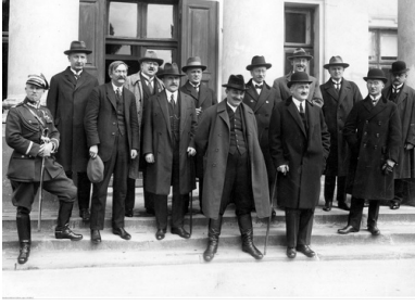
Gabinet Wincentego Witosa, 11 maja 1926 r.