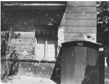
Uszkodzona ściana kamienicy przy Alejach Ujazdowskich 9. Widoczne ślady po ostrzale z karabinu maszynowego, maj 1926

Na moście Poniatowskiego Piłsudski pojawił się około 16.00, tam oczekiwał nań prezydent. Spotkanie zakończyło się fiaskiem. Wojciechowski zaproponował Piłsudskiemu powrót na drogę legalną, co oznaczało przyznanie się do porażki. Co gorsza Marszałek usłyszał, że to właśnie prezydent stoi na straży honoru armii i przekonał się naocznie, że żołnierze gotowi są wymierzyć broń w niego samego. Skoro zaś Piłsudski kapitulować nie zamierzał, pozostawała mu już tylko orężna walka.