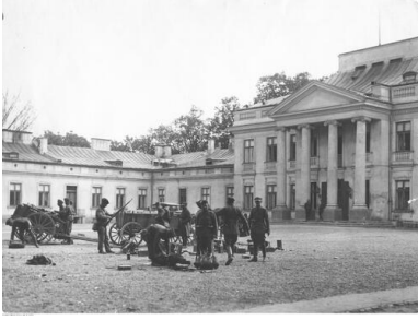
Grupa żołnierzy marszałka Józefa Piłsudskiego na placu przed Belwederem, maj 1926