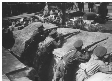
Szwależerowie podczas strzelania z karabinów w okopach na jednej z ulic Warszawy, maj 1926