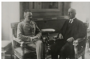
Naczelnik Państwa Józef Piłsudski w rozmowie z prezydentem elektem Gabrielem Narutowiczem, Warszawa, Belweder, 10 grudnia 1922 r.

systemu demokracji parlamentarnej za ustrój właściwy dla Polski.