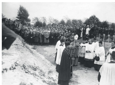
Duchowni różnych wyznań podczas modlitwy nad mogiłą ofiar przewrotu majowego, m.in. biskup polowy Stanisław Gall (w stroju ceremonialnym). Na drugim planie, wśród uczestników pogrzebu (czwarty z lewej w pierwszym rzędzie) premier Kazimierz Bartel (fot. z