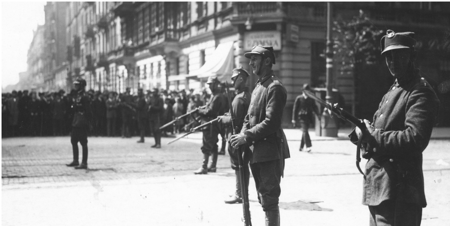
Posterunek wojskowy na rogu ulic Marszałkowskiej i Nowogrodzkiej w Warszawie, 12 maja 1926 r.

https://przystanekhistoria.pl/pa2/tematy/maj-1926/125047,Przewrot-majowy-1926-r-z-perspektywy-stulecia.html