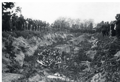
Pogrzeb ofiar przewrotu majowego, mogiła zbiorowa, maj 1926 r.

Niektórzy szukali możliwości zgłoszenia akcesu do zwycięskiego obozu, innych razita bezideowość grupy ścigających karierowiczów: akceptując dyktaturę, chcieli napęlić ją ideową treścią... Na prawicy nasiliły się fascynacje faszyzmem włoskim, na lewicy dyktaturą proletariatu. Trwałe zepchnięcie do opozycji skutkowało ideologizacją programów politycznych i społecznych, w coraz większym stopniu stanowiących nie pragmatyczne recepty, konstruowane ze świadomością istniejących barier – ale projekcję ideologicznych wizji. Gdy perspektywa przejęcia władzy stała się nieokreślona, politycy nie musieli liczyć się z koniecznością tłumaczenia się z nierealizowania obietnic.