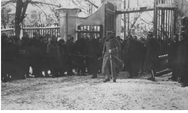
Wizyta marszałka Józefa Piłsudskiego u książąt Radziwiłłów w Nieświeżu, październik 1926 r.