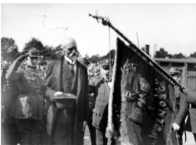
Prezydent RP Stanisław Wojciechowski przed frontem oddziałów wojskowych w Gnieźnie, wrzesień 1925 r.

W początkach lat 30. obóz rządzący przystąpił do przejmowania organizacji społecznych, potem przyszła kolej na samorząd. Reforma akademicka wydatnie ograniczyła autonomię szkół wyższych; porządkując zaś system prawny, nie tylko utrzymano wbrew wcześniejszym obietnicom karę śmierci, ale zakres jej stosowania uległ poszerzeniu. Nie można powiedzieć, by środowiska liberalnej inteligencji aprobowały nieuwzględnianie ich stanowiska w kolejnych sprawach, które przed 1926 r. przedstawiane były jako fundamentalnie ważne, ale obiekcje wobec ograniczania swobód obywatelskich zaznaczały się słabiej niż obawy, że ze swobód owych skorzysta prawica... Te fobie przyczyniały się do rozszerzenia swobody działania obozu rządzącego, uwalniając go od konieczności czynienia istotnych koncesji i dając czas na umocnienie władzy.