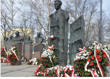
Pomnik Łukasza Cieplińskiego w Rzeszowie, odsłonięty w 2013 r.