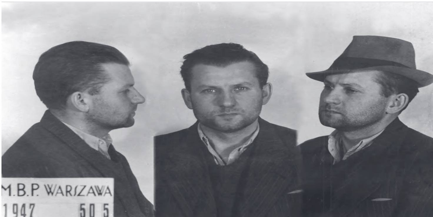
Zdjęcia sygnalityczne Łukasza Cieplińskiego.

https://przystanekhistoria.pl/pa2/tematy/lukasz-cieplinski/79225,Krwia-na-bibulce-testament-pisany-i-medalik-w-ustach.html