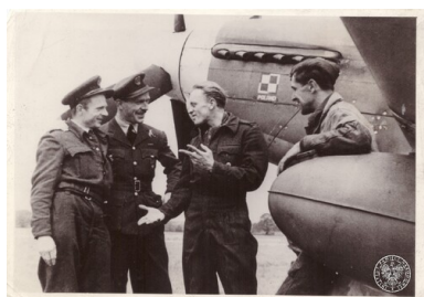
Polscy lotnicy przy myśliwcu North American P-51D Mustang.