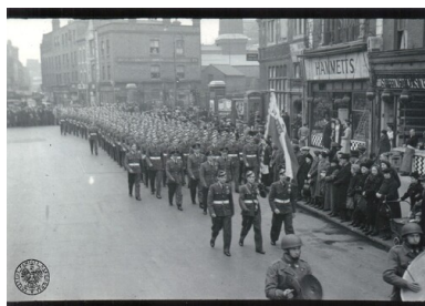
Kadeci Szkoły załóg powietrznych w Brighton w Anglii podczas defilady "Wings for Victory" w Londynie. Fot. z zasobu IPN (kolekcja Stowarzyszenia