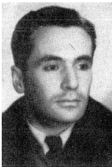
Kazimierz Leski

W tej sytuacji Polacy, nie bez wielkich wstrząsów i sporów politycznych, takich jak dokonany w maju 1926 r. zamach stanu Józefa Piłsudskiego, wykonali wspólnie wielki wysiłek organizacyjno-cywilizacyjny na rzecz konsolidacji swego państwa. Rozbudowano armię i policję. Zorganizowano doborowe wojska graniczne (KOP). Ujednolicono szkolnictwo i system prawny; przy czym niektóre przyjęte rozwiązania były uznawane za wybitne na skalę światową. Poczyniono też szereg wielkich inwestycji infrastrukturalnych na rzecz dobra wspólnego m.in. budując od podstaw port handlowy w Gdyni, a następnie, z pomocą Francji, strategiczną linię kolejową łączącą polskie kopalnie węgla na Śląsku z nowym polskim portem, stanowiącą swego rodzaju kręgosłup gospodarki państwa. W przeludnionym rolniczym centrum kraju rozpoczęto budowę nowego okręgu przemysłowego. Z wielkim rozmachem planowano rozwój stołecznej Warszawy, w której wyrastały kolejne modernistyczne gmachy.