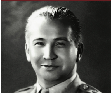
Pułkownik dypl. Leopold Okulicki, pierwszy dowódca Bazy nr 10, 1943