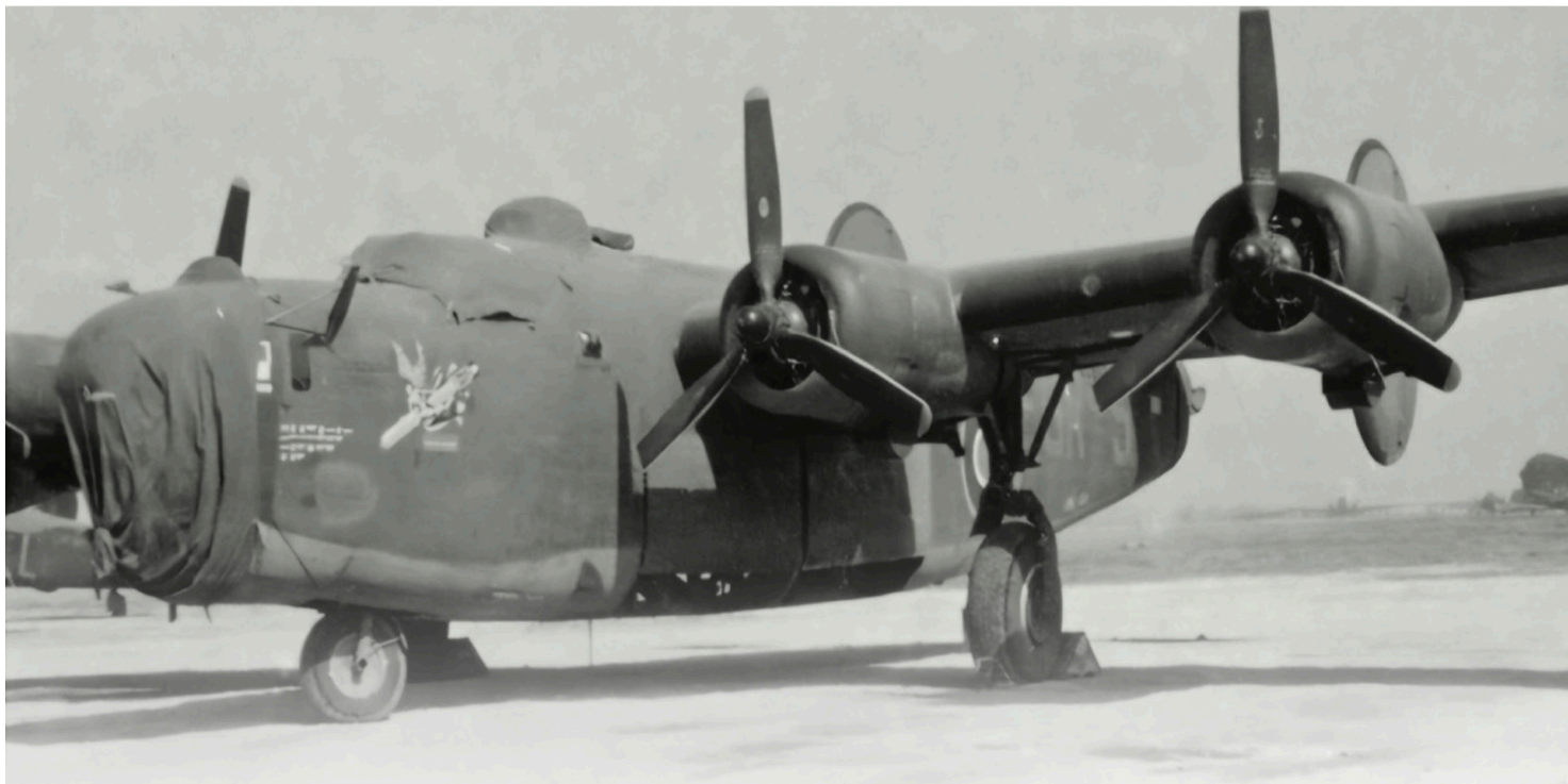
Liberator BZ965 kpt. Zbigniewa Szostaka z 1586 Eskadry na lotnisku w Brindisi

https://przystanekhistoria.pl/pa2/tematy/lotnictwo/125224,Glowna-Baza-Przerzutowa.html